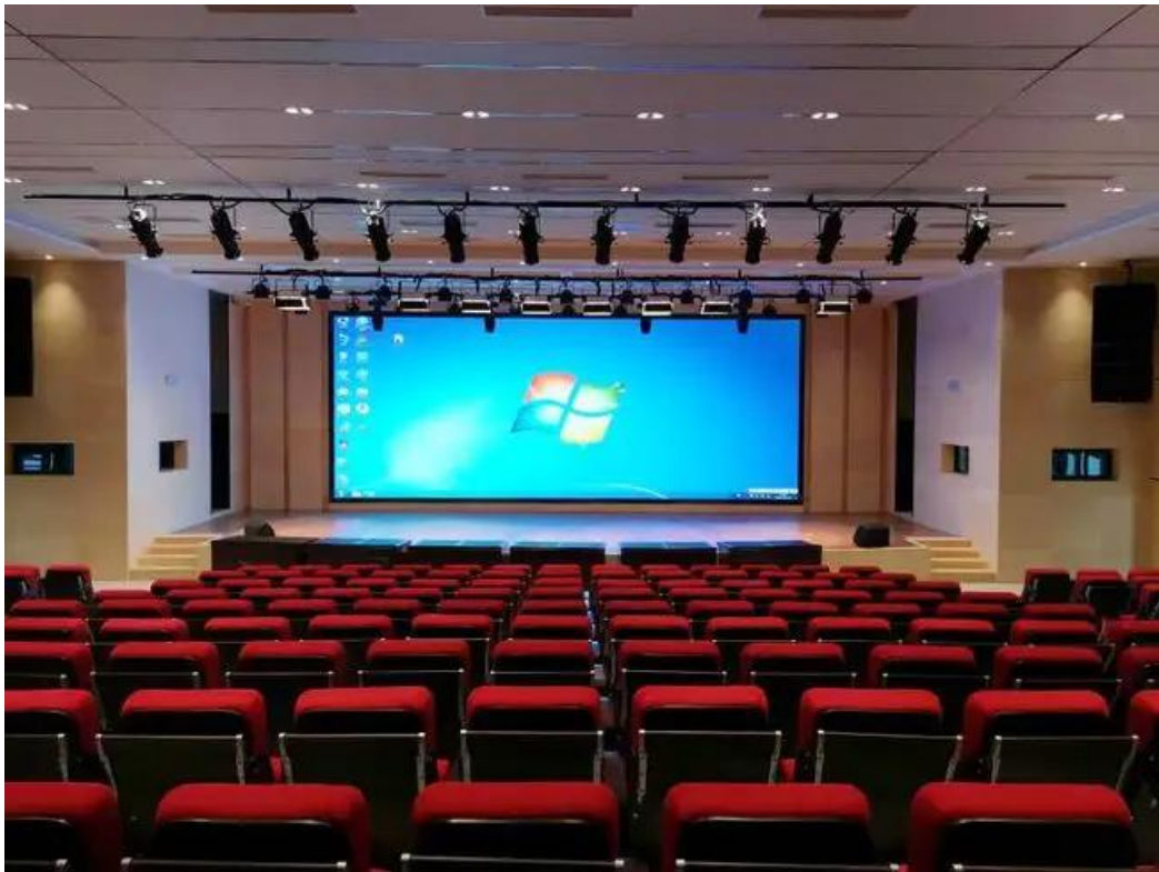
总决赛答辩场景模拟