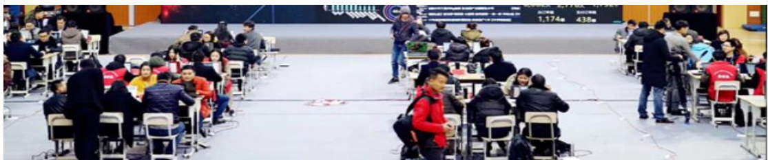
总决赛竞赛场景模拟

6. 赛事单元相对独立，确保选手独立开展比赛，不受外界影响；赛区内包括厕所、医疗点、维修服务站、生活补给站、垃圾分类收集点等都在警戒线范围内，确保竞赛在相对安全的环境内进行。