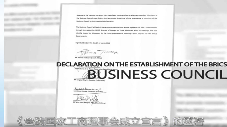
《金砖国家工商理事会成立宣言》的签署

金砖国家(BRICS)引用了巴西(Brazil)、俄罗斯(Russia)、印度(India)、中国(China)和南非(South Africa)的英文首字母。按照BRICS顺序执行主席国轮值机制， 是我国重要的战略依托。