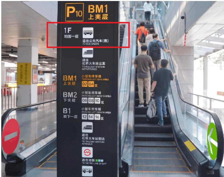
图 3：扶梯上 1F 至地面公交

(2) 上海站：东南出口，南广场方向，乘地铁 1 号线（莘庄方向）→徐家汇站，站内换乘 9 号线（上海松江站方向）→松江江新城站下，出 4 号口→步行 1.5 公里至上海花惜美拾酒店。