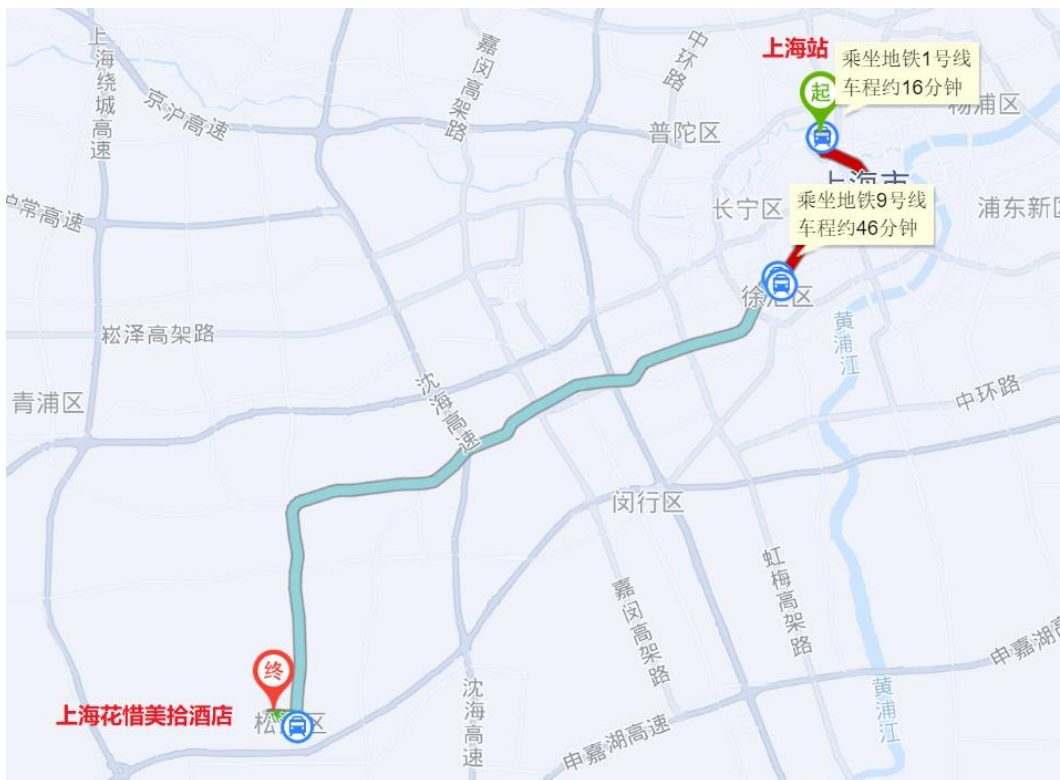
图 4：上海站至酒店路线总图

(2) 上海站：东南出口，南广场方向，乘地铁 1 号线（莘庄方向）→徐家汇站，站内换乘 9 号线（上海松江站方向）→松江江新城站下，出 4 号口→步行 1.5 公里至上海花惜美拾酒店。